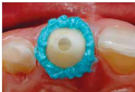
VOCO Retraction Paste aplicada