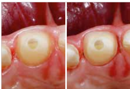
Antes Después

Es estable en el surco - esto conduce a una expansión temporal efectiva. Tras un breve tiempo de aplicación de 1 a 2 minutos, la VOCO Retraction Paste de alto contraste puede ser enjuagada fácilmente.