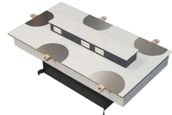
Torreta de 3 enchufes + puertos USB.