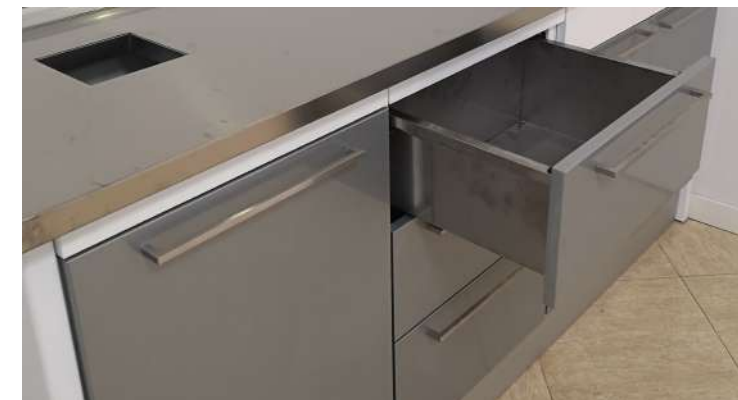
Detalle cajón de inox para escayola