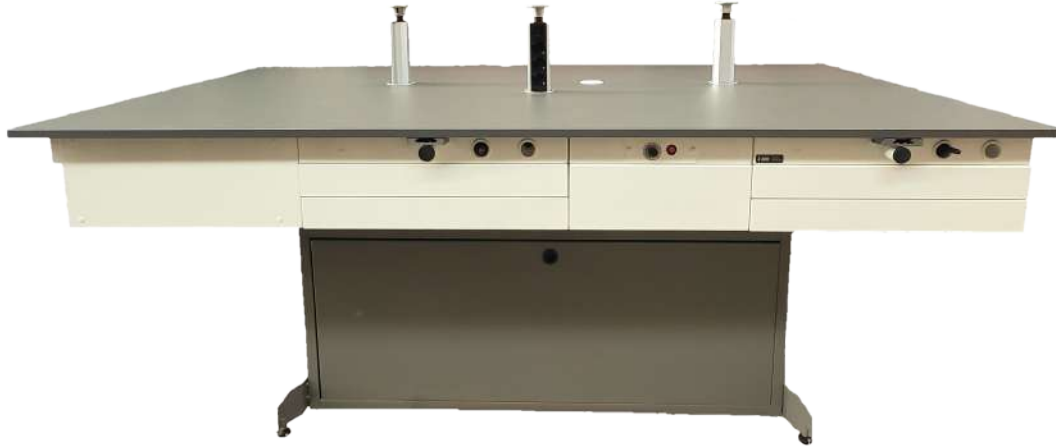
Mesa Madagascar 5 puestos