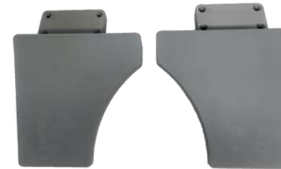
Set de apoyabrazos