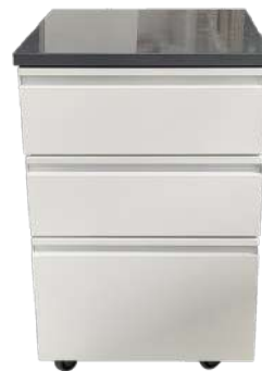
Modulo auxiliar rodante