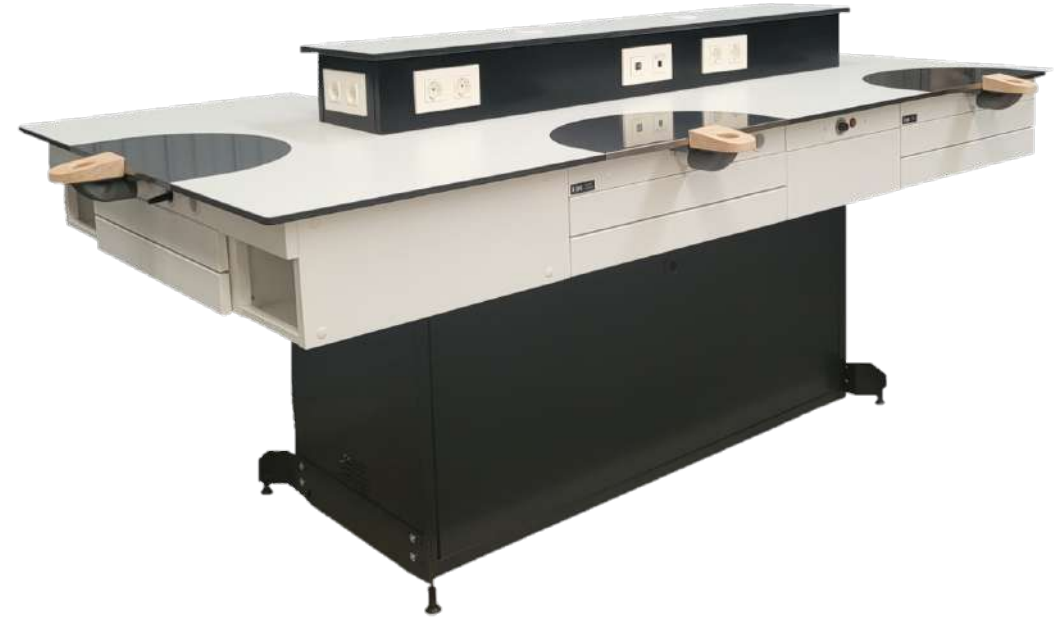
Mesa Madagascar 5 puestos con consola