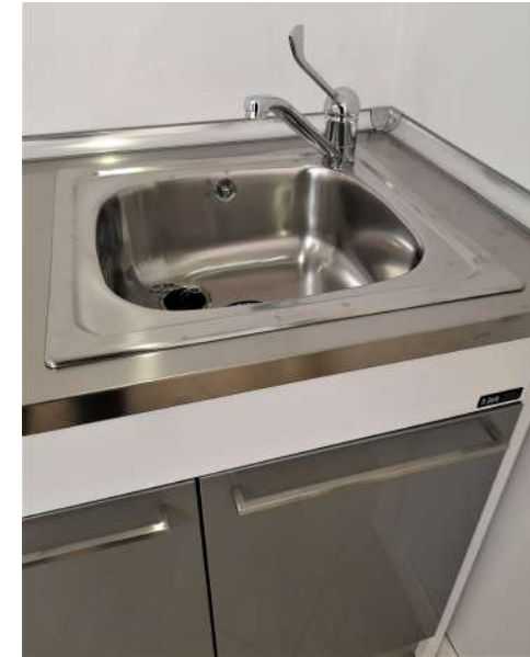
Detalle fregadero y grifo gerontológico