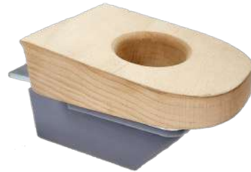
Astillera de aspiración