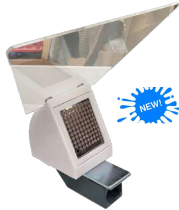
Astillera de aspiración con pantalla